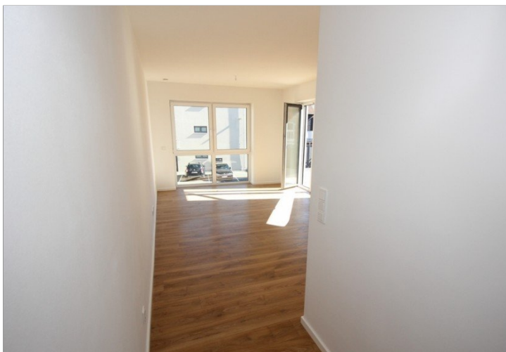
Flur zum Wohnzimmer